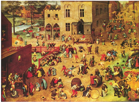
Pieter Bruegel de Oude – Kinderspelen (1560)

Kinderen observeren de wereld van volwassenen. Ze imiteren die in hun spel. Door imitatie van volwassenen trainen zij hun sociaal en emotioneel gedrag. Daarmee bevorderen zij spelenderwijs ook hun motoriek en wereldoriëntatie. Het bezoek aan het museum levert een bijdrage aan dat proces.